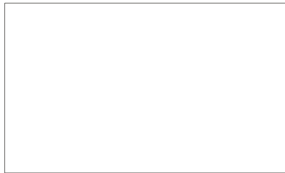
Bechyně - pohlednice

Pozn.: v minulém čísle vzbudila značný zájem veřejnosti fotografie "1. máje v Bechyni 1910". Fotografie byla pořízena v prostoru, kde dnes stojí bechyňské kino. Na fotografii je kapela p. Jirky ze Sudoměřic.