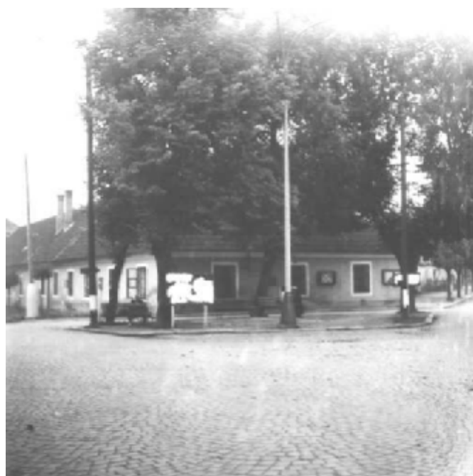
Zmizelá Bechyň - křižovatka Čechovy a Libušiny ulice (U Podlahů).

Zámek byl předán ČSAV k rekreačním a studijním účelům.