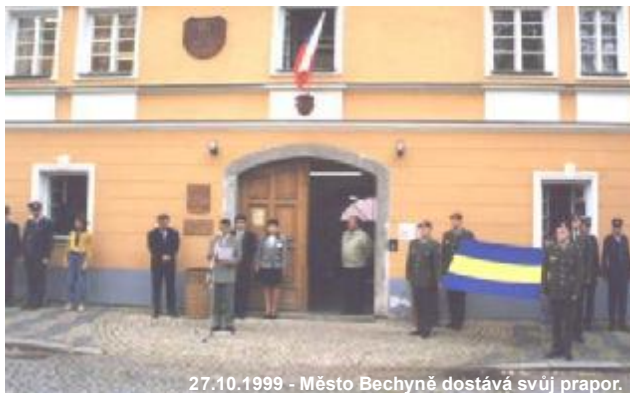
27.10.1999 - Město Bechyň dostává svůj prapor.

Pokračuje rekonstrukce památkového objektu „U bílého zvonu“ a Městského muzea.